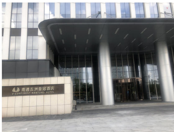
图3 南通五洲皇冠酒店